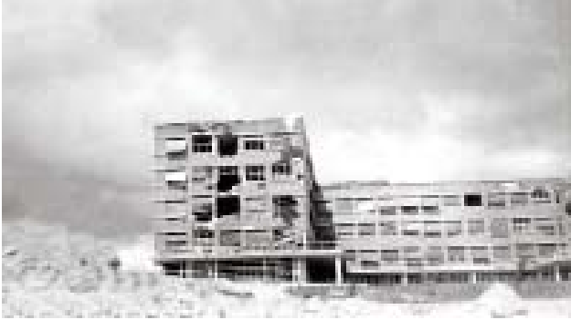
Fachada posterior de la Facultad desde una trinchera en la primera línea del frente. ABC , 16 de abril de 1937.