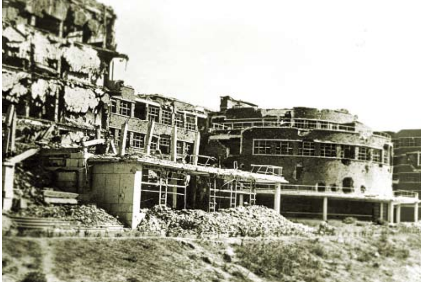
Fachada posterior de la Facultad al final de la Guerra Civil. La primera crujía de la izquierda se derrumbó en toda su altura. Servicio Histórico Fundación Arquitectura COAM.