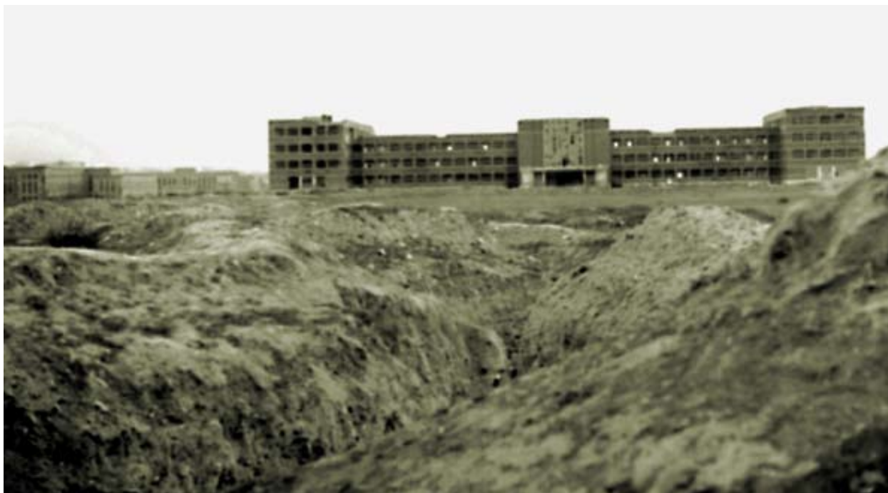
Los daños de la fachada delantera de la Facultad fueron muy inferiores a los sufridos por la otra fachada. Se aprecian algunas roturas en la cristalería del vestíbulo. 1940.