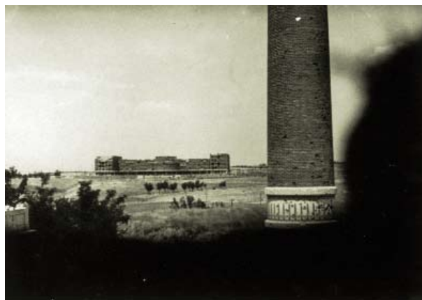
Agrónomos, la Casa de Velázquez, Arquitectura y el Viaducto de los Quince Ojos, ocupados por las tropas enemigas, desde la Facultad de Filosofía y Letras. 31 de mayo de 1937. Fotografía de Albero y Segovia. AGA.