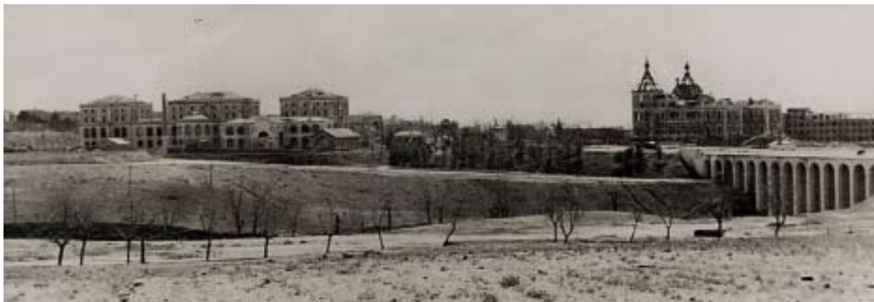
Agrónomos, la Casa de Velázquez, Arquitectura y el Viaducto de los Quince Ojos desde la Facultad de Filosofía y Letras. 13 de marzo de 1937. Esos edificios marcan las líneas del frente.