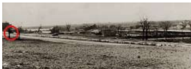
La Casa de Velázquez, Arquitectura y, a la derecha en la continuación de la panorámica, las instalaciones de la Granja de Castilla (en la actual Presidencia de Gobierno), vistas desde la Facultad de Filosofía y Letras. 13 de marzo de 1937. Sobre la actual carretera de La Coruña se divisa el carro que aparece posteriormente en las fotos tomadas en mayo de 1938 desde las filas de los asaltantes y marca la situación de las líneas enemigas.