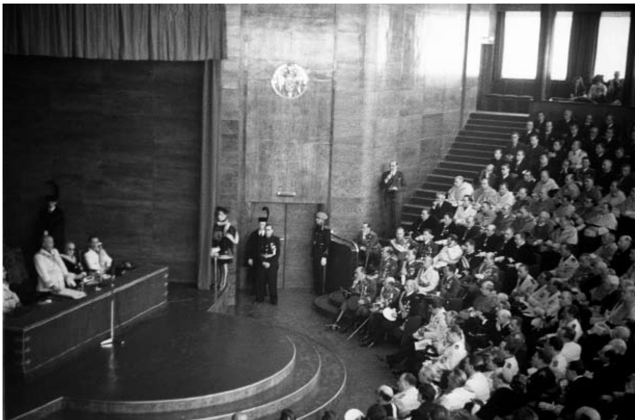
Francisco Franco en el Paraninfo de la Facultad el día de su reinauguración (12 de octubre de 1943). A su derecha el ministro de Educación Nacional, José Ibáñez Martín, y el obispo auxiliar de Madrid-Alcalá, Casimiro Morcillo (fuera de la foto), a su izquierda el rector de la Universidad, Pío Zabala, y el jefe del SEU, Carlos María Rodríguez de Valcárcel. Véase ABC, 13 de octubre de 1943, pág. 12.