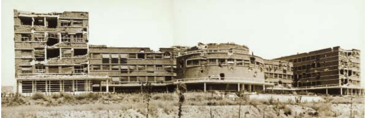
Fachada posterior. 31 de mayo de 1937. A partir de las fotos de mayo se observan pilares rotos en la zona izquierda y losas quebradas en la derecha. Fotografía de Albero y Segovia. BNE.