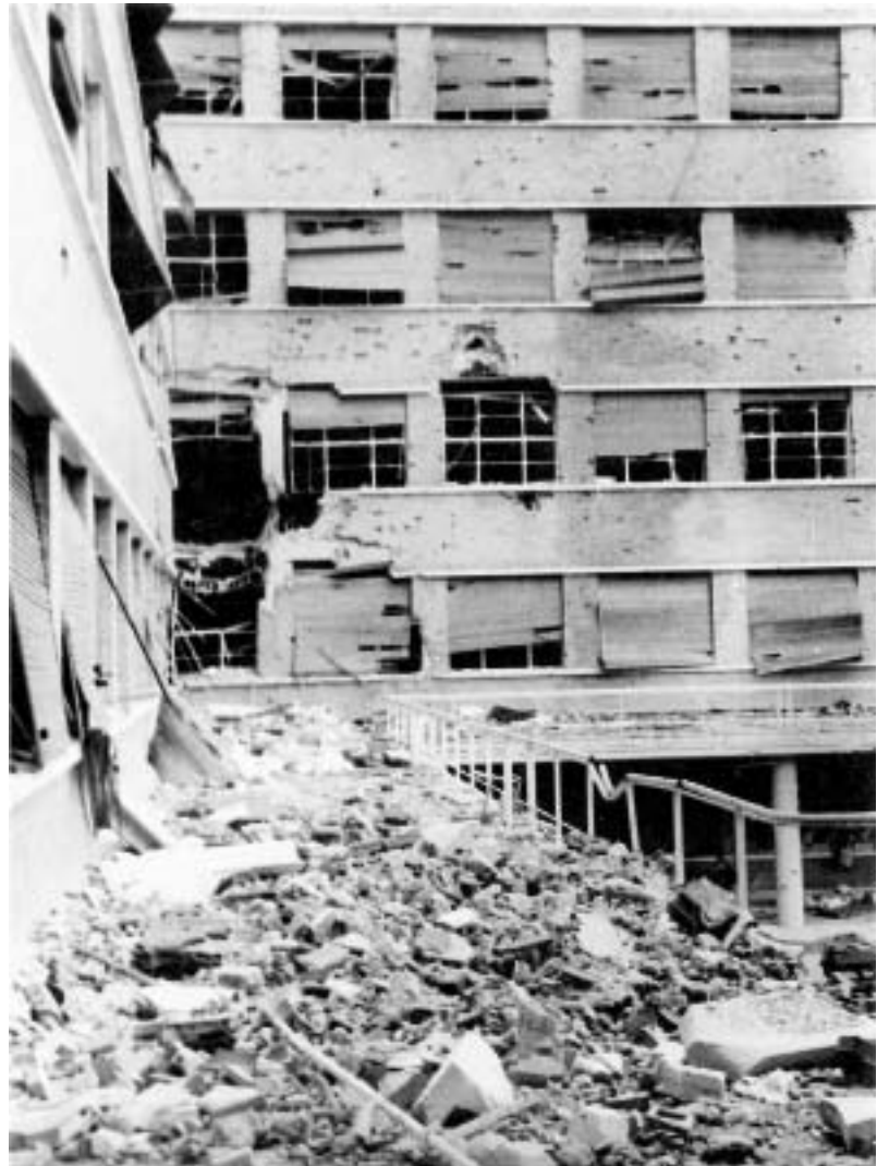
Fachada posterior de la Facultad. ABC , 22 de abril de 1937.