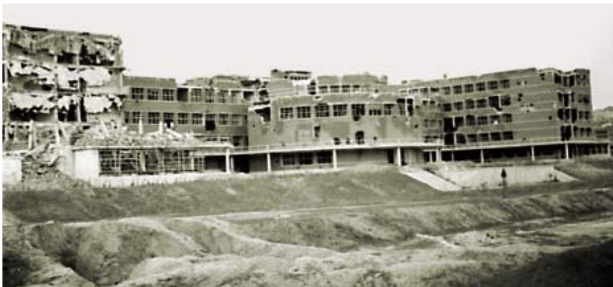
Fachada posterior de la Facultad. 1940.