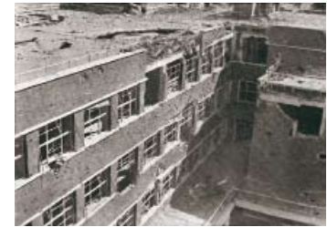
Fachada posterior de la Facultad desde la terraza, en la derecha el salón de actos. Revista Nacional de Arquitectura , 7 (1941).