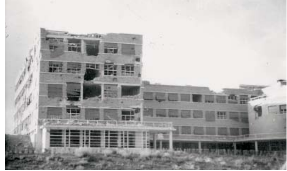
Fachada posterior de la Facultad desde una trinchera en la primera línea del frente. Fotografía de Díaz y Casariego. ABC , 16 de abril de 1937.