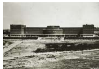
La Facultad de Filosofía y Letras, finalizada su construcción, esperaba la inauguración de su cuerpo central y del lateral oeste. BNE.

El mismo interés que me invadió lo he observado en muchos profesores de esa Facultad y espero me disculpen los que ya conozcan los datos que me siento obligado a recordar. Para no fatigar al lector, he procurado condensarlos y he