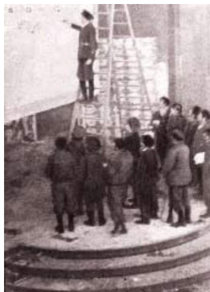
Milicianos en el salón de actos de la Facultad. ABC , 23 de abril de 1937.