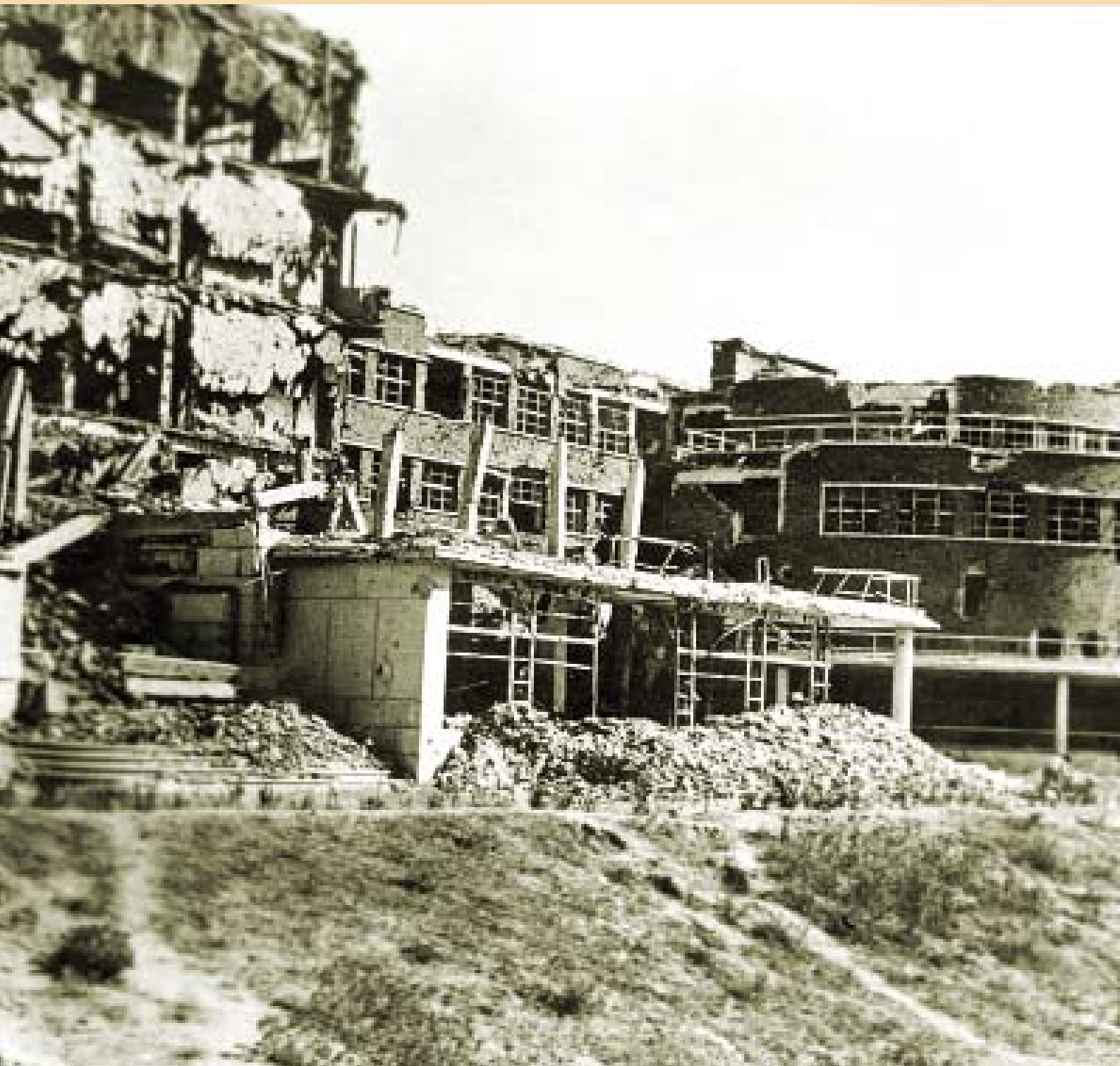
Fachada posterior de la Facultad al término de la Guerra Civil.