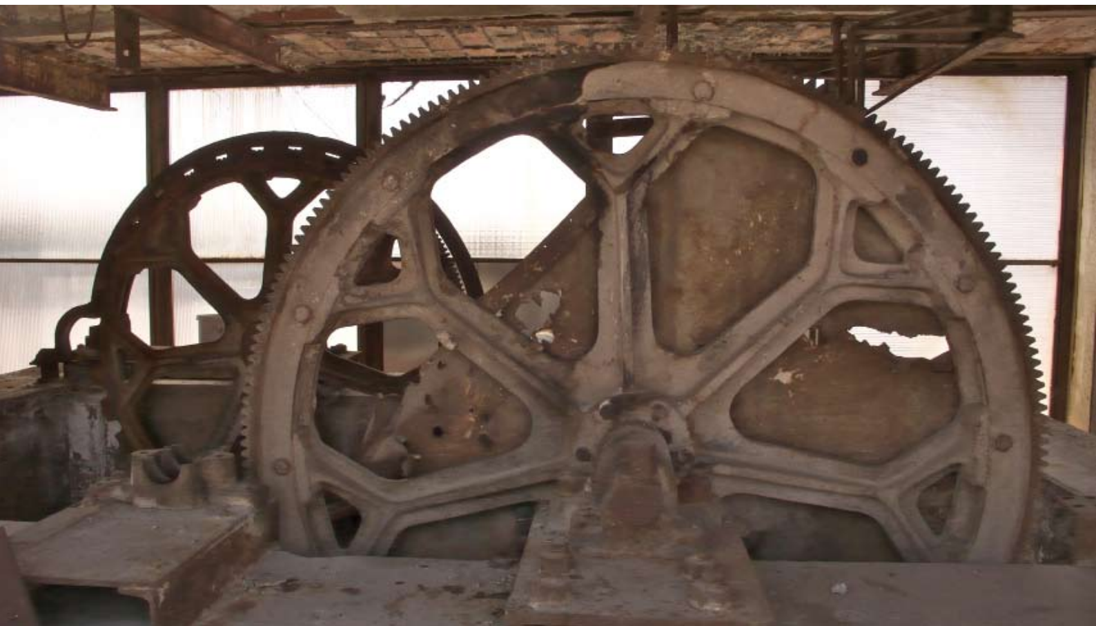
El frente de la Ciudad Universitaria: la maquinaria del ascensor continuo paternoster en la azotea del edificio de la Facultad de Filosofía y Letras. Aquí se encontraba la primera línea del frente republicano. Aún hoy se aprecian los impactos en las chapas de las ruedas que movían las cabinas.