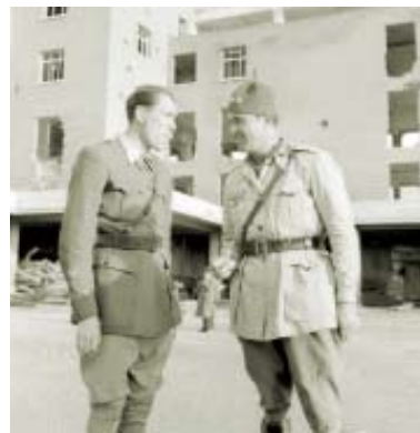
Fachada del patio interior-jardín de la Escuela de Arquitectura. Al lado aparece el coronel Joaquín Ríos Capapé (al mando de la 18 División) con un capitán. AGGCE. Col. Deschamps, 1939.

Al terminar la guerra se consideró la posibilidad de dejar la Ciudad Universitaria como campo de recuerdo de los años de lucha 26 ; Franco finalmente decidió su reconstrucción y los edificios tuvieron su reestreno el 12 de octubre de 1943, en una especial conmemoración del «día de la raza», para la cual se preparó un fastuoso espectáculo de corte fascista en el campus de Medicina.