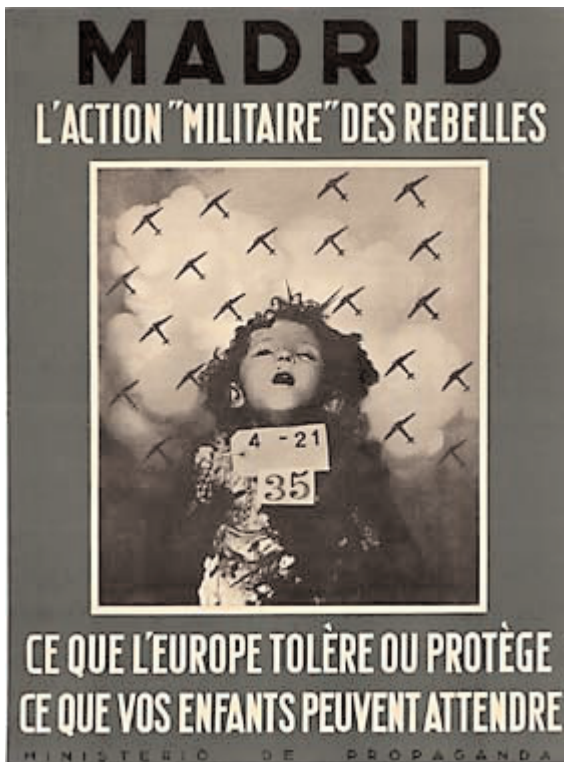
Madrid, L'Action "Militaire" des rebelles ce que L'Europe tolère ou protège ce que vos enfants peuvent attendre. Ministerio de Propaganda. Madrid, 1937

Festival benéfico, a beneficio de los niños acogidos en la Casa Cuna que consiste en un partido de fútbol entre los equipos Batallón Deportivo (integrado por jugadores del Madrid F.C. y el Athletic de Madrid. Casa Cuna en Velásquez 67.