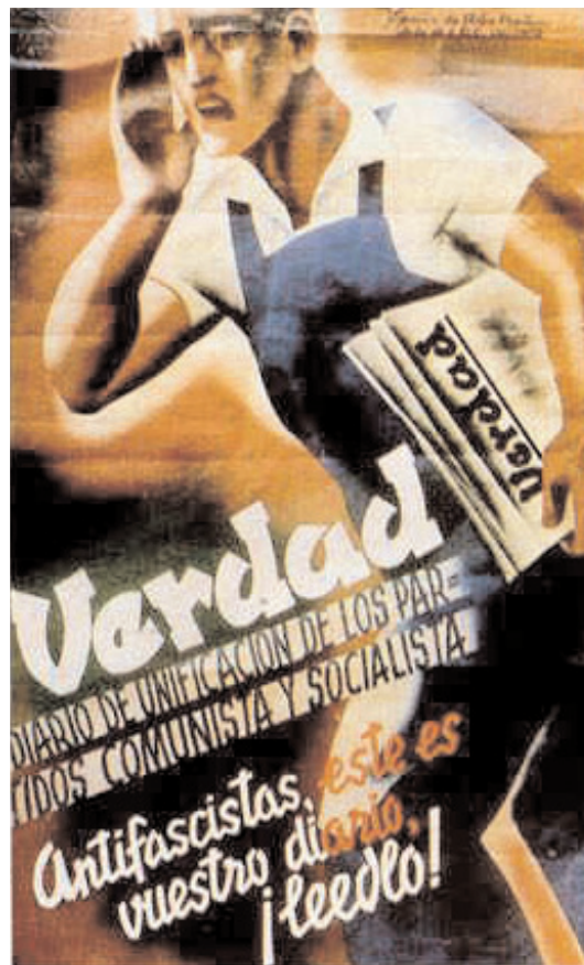
Verdad - Diario de Unificación de los Partidos Comunista y Socialista. Antifascistas este es vuestro diario, ¡leedlo!

29 de septiembre de 1936. Un decreto de la Junta rebelde, amplía los poderes de Franco a jefe de estado.