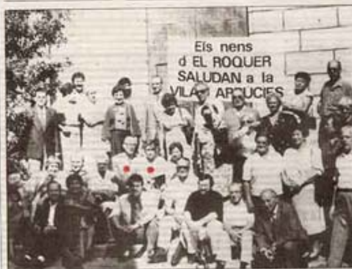
Els nens d'EL ROQUER SALUDAN a la VILA d'ARBÚCIES